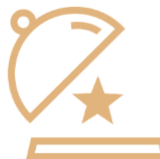
Checking product quality >