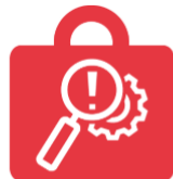
First Aid >