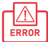
Error Codes >