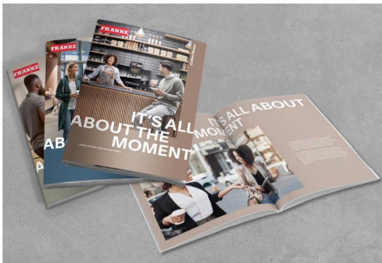
Légende: l'image de marque de Franke Coffee Systems prend vie dans un design frais et contemporain

En parcourant les produits spécifiques et les technologies ciblées de Franke Coffee, les utilisateurs du nouveau site coffee.franke.com embarquent dans un voyage interactif pour découvrir comment Franke transforme le changement en opportunités.