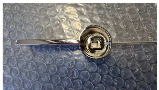
Kuva Lukitusruvi sijaitsee kahvan sisällä(myötäpäiväiset kierteet)