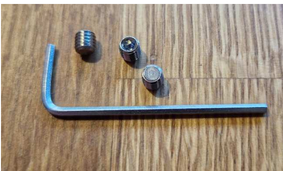
Kuva Lukitusruuvi HST 5x5mm