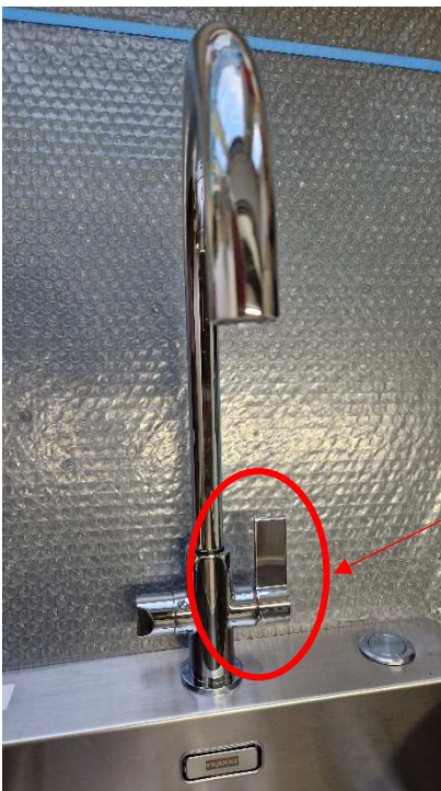
Kuva Franke Neptun L / J / Semi-Pro

115.0617.501 Tap Neptune Semi-Pro CHROME 115.0617.505 Tap Neptune Semi-Pro STEEL OPTIC 115.0617.506 Tap Neptune Semi-Pro MATT BLACK