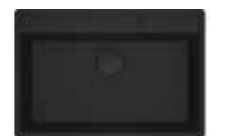
MRG 610-72 TL