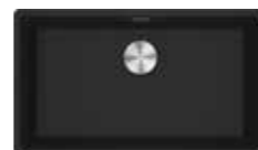
MRG 610-72 MRG 210/110-72