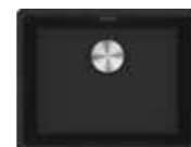
MRG 610-52 MRG 210/110-52