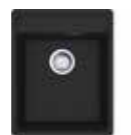
MRG 610-37 TL