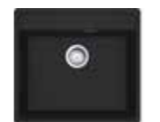
MRG 610-52 TL