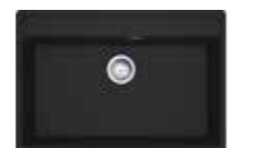
MRG 610-72 TL