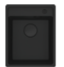
MRG 610-37 TL