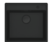
MRG 610-52 TL