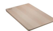
PLANCHE À DÉCOUPER EN ÉRABLE MASSIF

Conçu avec un rebord d'appui incorporé, votre évier a été fabriqué pour recevoir un ensemble d'accessoires visant à simplifier le déroulement de vos tâches dans la cuisine. Passez en douceur de la préparation au séchage en passant par le découpage, le rinçage, l'égouttement et le lavage, grâce à ces caractéristiques sur mesure.