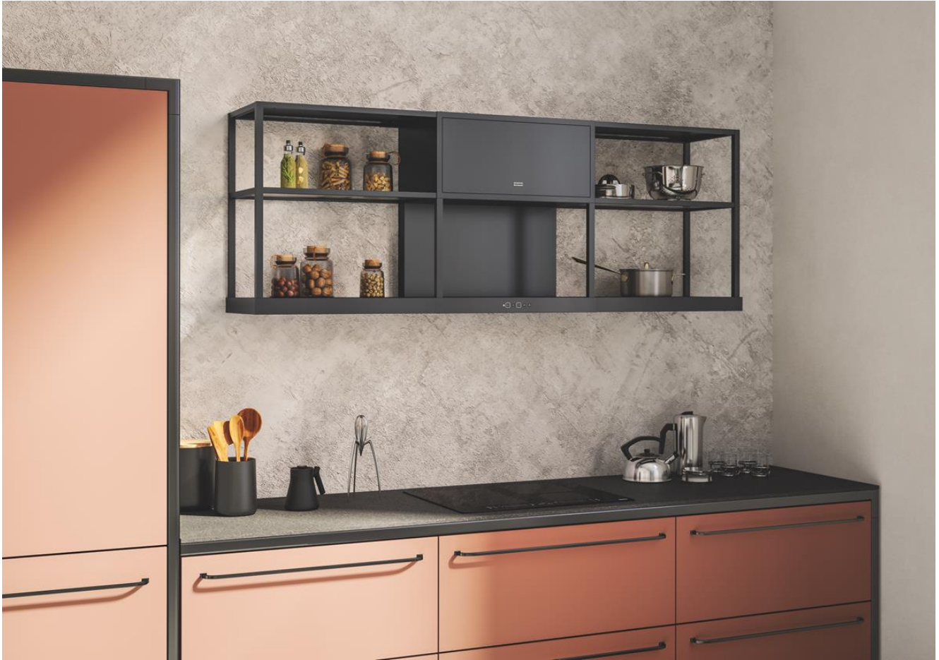
Maris Modular van Franke, prijs vanaf €1.150,50 incl. BTW. Aanbouwelementen voor Maris Modular, prijs: €629,20 incl. BTW.