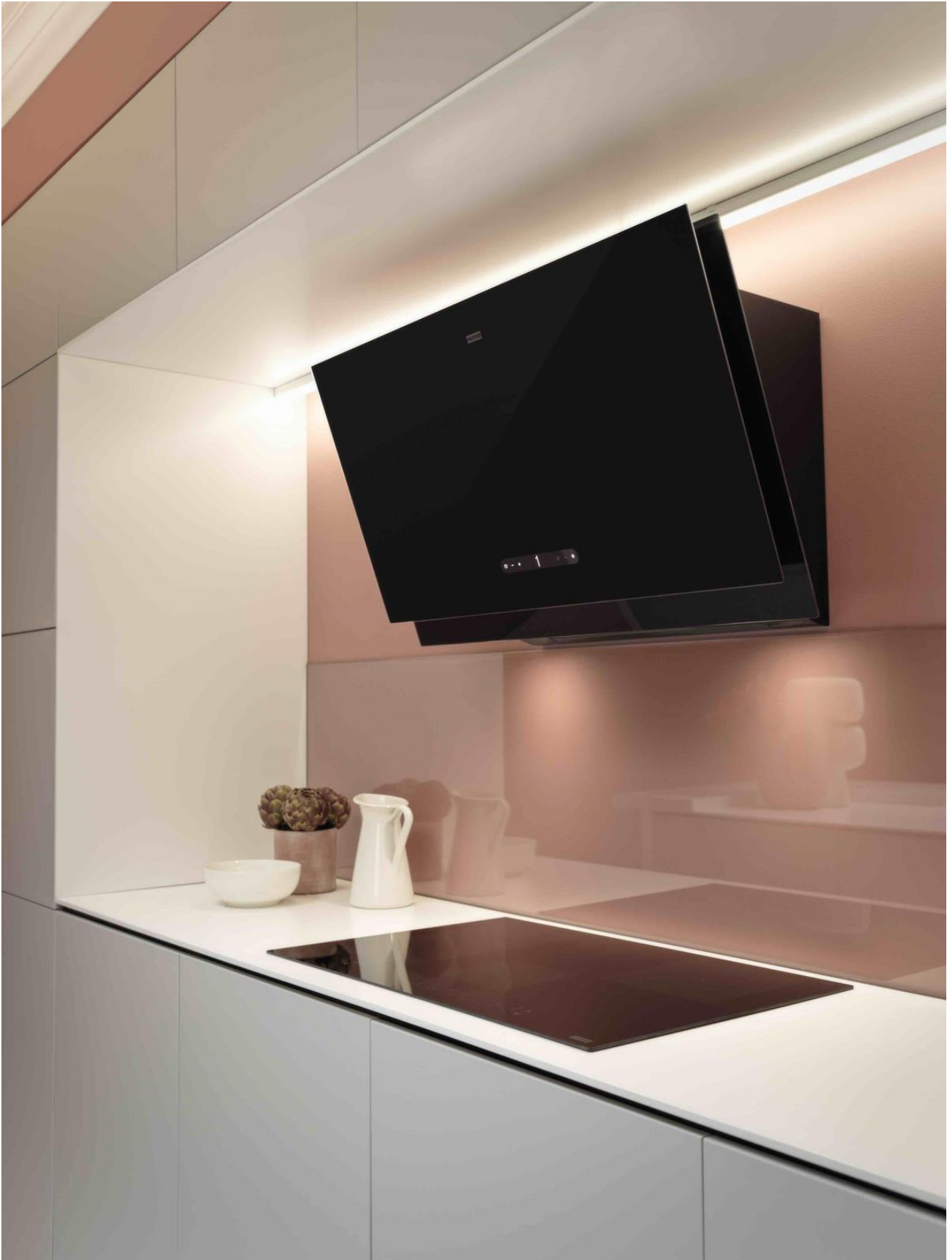
Maris 2.0 dampkap, zwart glas. Prijs: €1.270,29 incl. BTW.