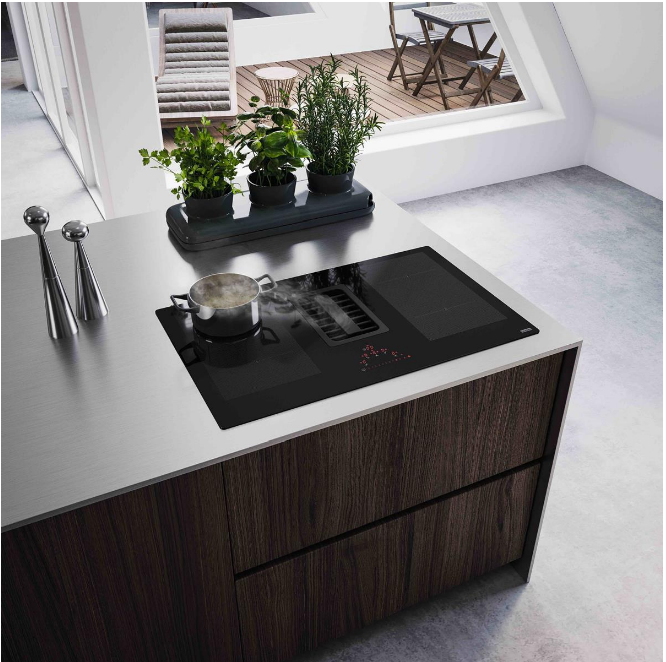
Maris 2gether kookplaat met ingebouwd afzuigstelsel, zwart glas. Prijs: €2.666,67 incl. BTW.

Speaking of... De juiste afzuiging of dampkap zorgt voor een dampvrije keuken, waar er bovendien steeds een frisse geur hangt. Laat het maar aan Franke over om een stijlvol alternatief te bedenken die vooral ook uiterst functioneel is. De Mythos- en Maris Vertical Pro-dampkappen zijn een designwaardige aanvulling op de keuken en worden verticaal aan de muur bevestigd. Het brede ontwerp, dubbele afzuigstelsel en de ingebouwde vetfilter maken voor een krachtige luchtreiniging. Maak je geen zorgen, de innovatieve Sound Pro-technologie garandeert ten slotte een fluisterstille afzuiging voor het ultieme kookgemak.