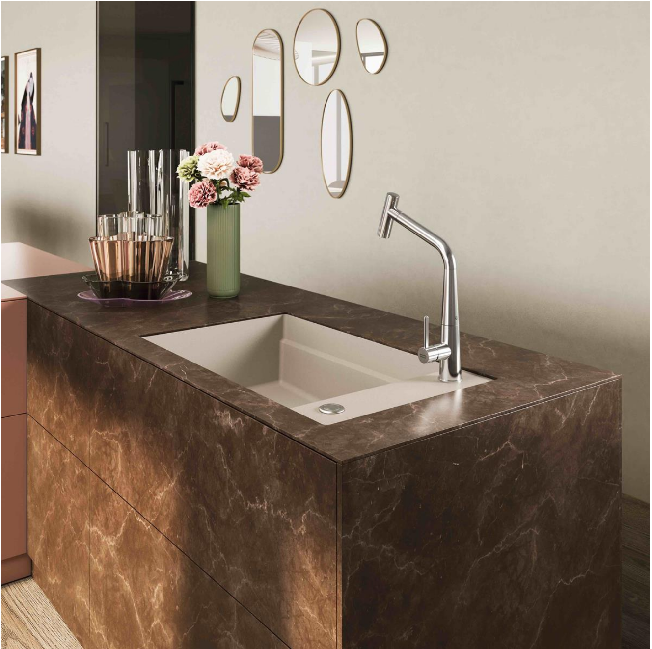
Kubus 2.0 Fraganite spoelbak, koffieroom. Prijs: €1.012,65 incl. BTW