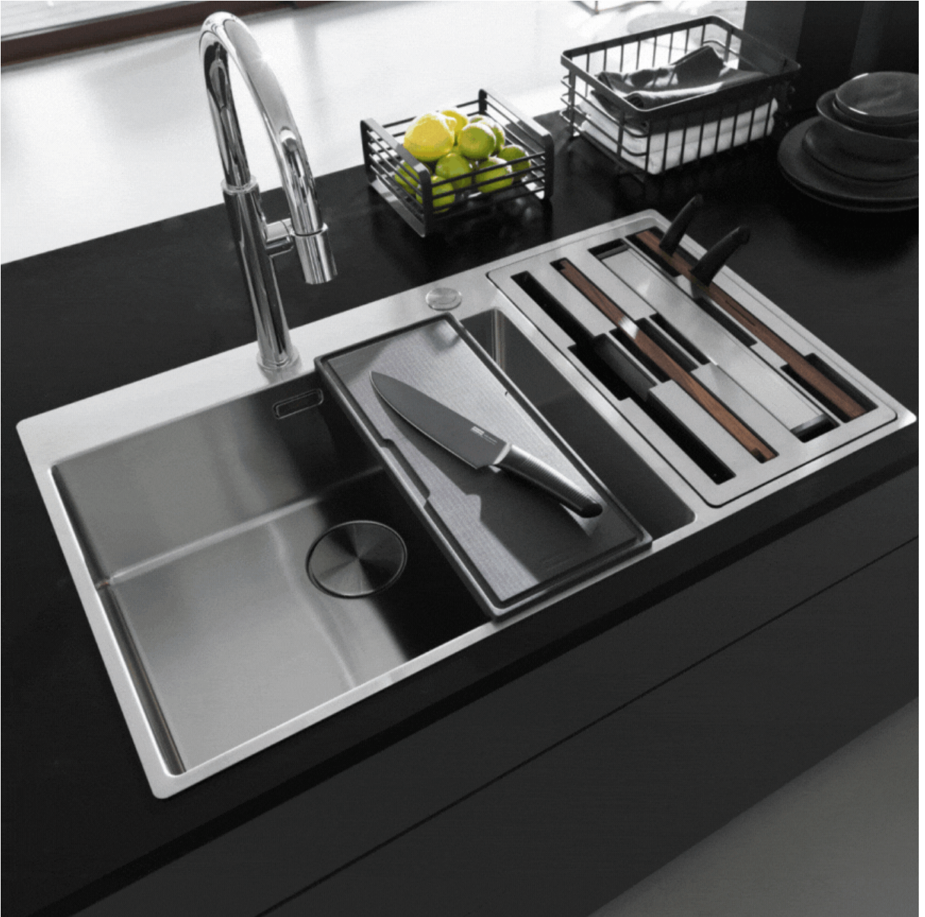
Évier Box Center en acier inoxydable, avec accessoires. Prix : 1 949,73 € TTC.