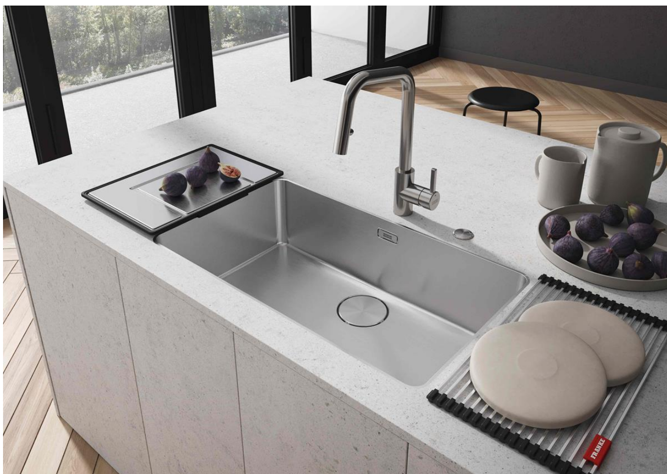
Image d'ouverture : Évier Mythos Masterpiece en acier inoxydable, doré. Prix : 2 783,00 € TTC. Ci-dessus : Évier Mythos en acier inoxydable. Prix : 1 006,86 € TTC.

L'évier est le point central de la cuisine. De la préparation des aliments au nettoyage, toutes les tâches commencent et se terminent ici. Pour les familles nombreuses ou les cuisiniers expérimentés, il peut s'agir d'un véritable poste de travail, avec des fournitures et des accessoires pratiques à portée de main. L'expert en cuisine Franke a tout ce dont vous avez besoin pour aménager votre évier de manière modulaire, tel un véritable couteau suisse, où chaque section a sa propre fonction - selon vos souhaits et vos besoins, bien entendu