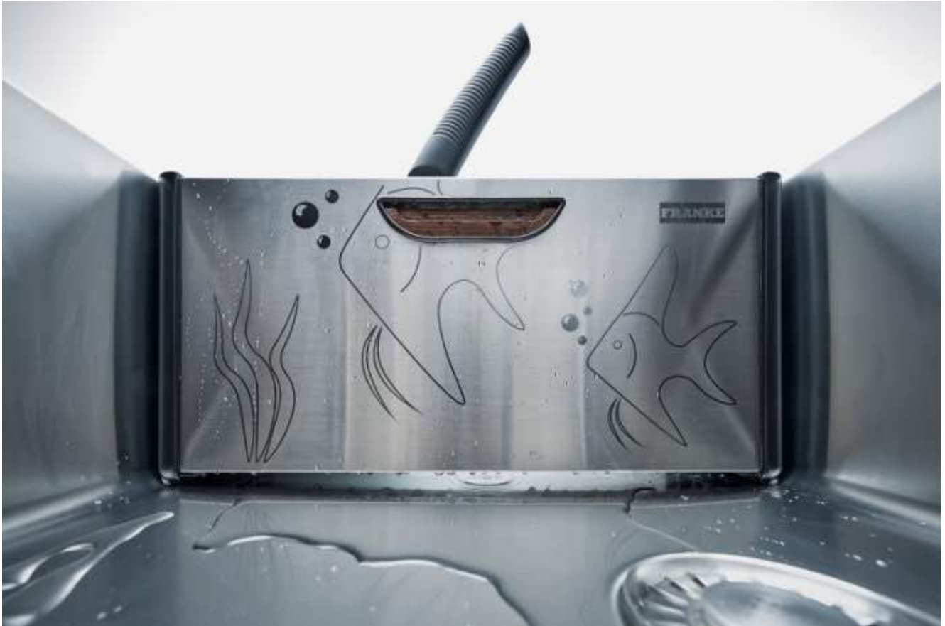
Ensemble d'accessoires Andy Chef avec planche à découper en bois, couteau de chef et égouttoir en acier inoxydable. Prix : 437,39 € TTC.