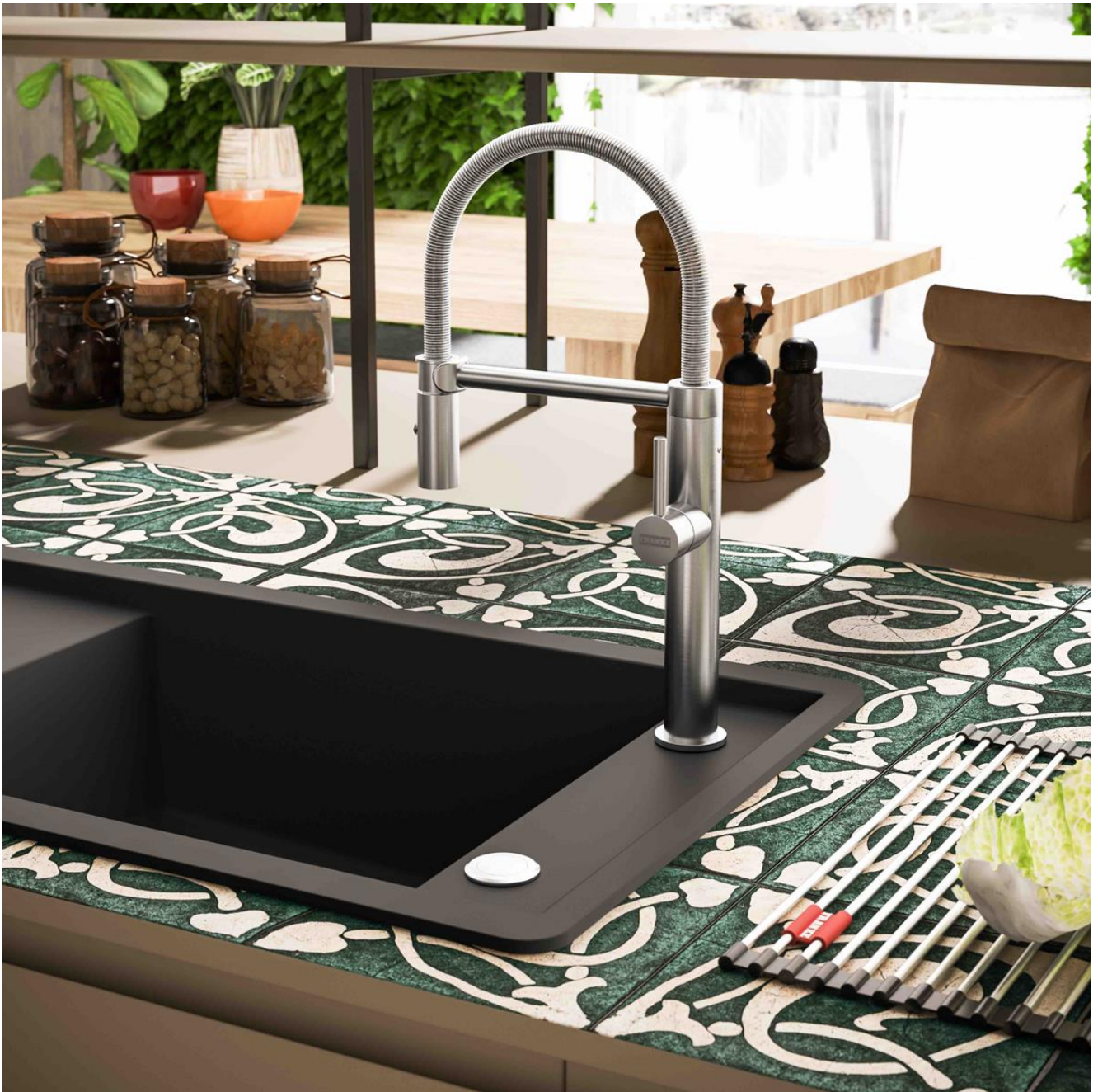
Mitigeur Pescara à bec mobile, inox. Prix: €899,13 TVA comprise.