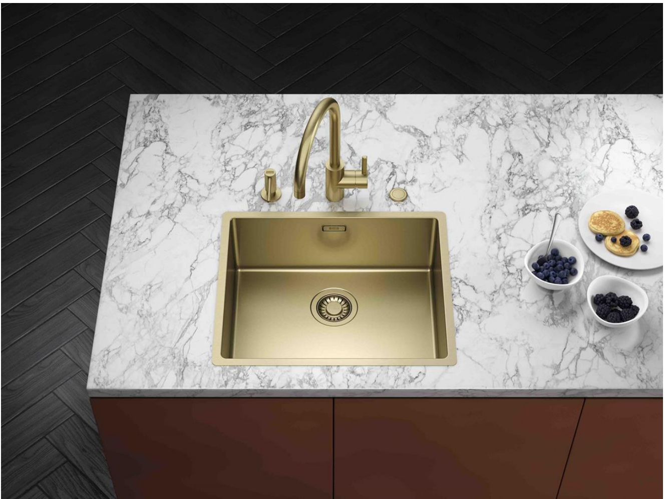
Mitigeur Eos Neo à bec orientable, doré. Prix: €616,63 TVA comprise.