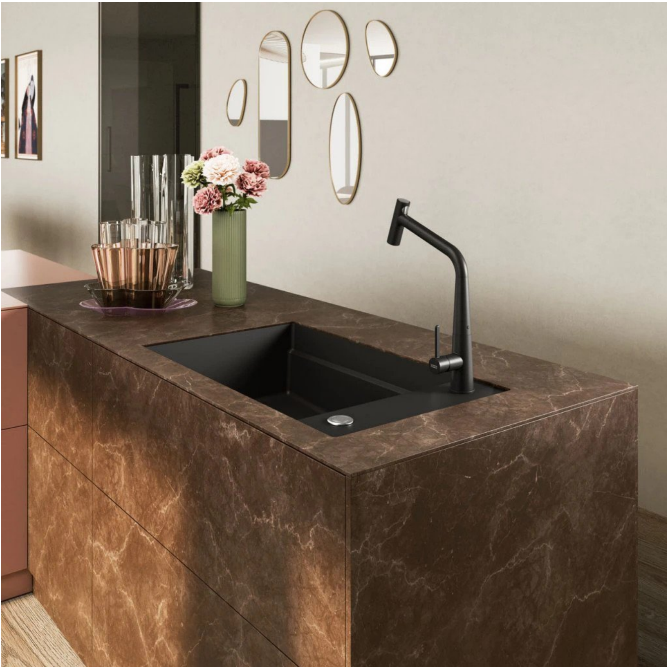
Mitigeur Icon à bec extractible, noir mat. Prix: €956,83 TVA comprise.