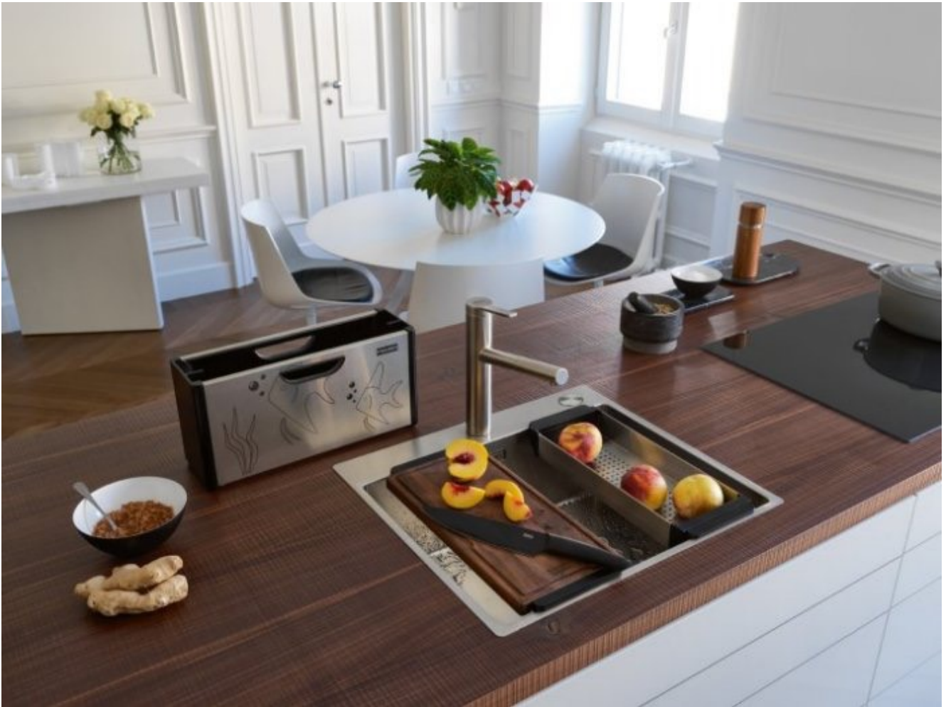
Mitigeur Tango Neo à bec extractible, inox. Prix: €602,45 TVA comprise.

de mitigeurs et s'attarde sur celles qui auront indiscutablement le vent en poupe en 2023.