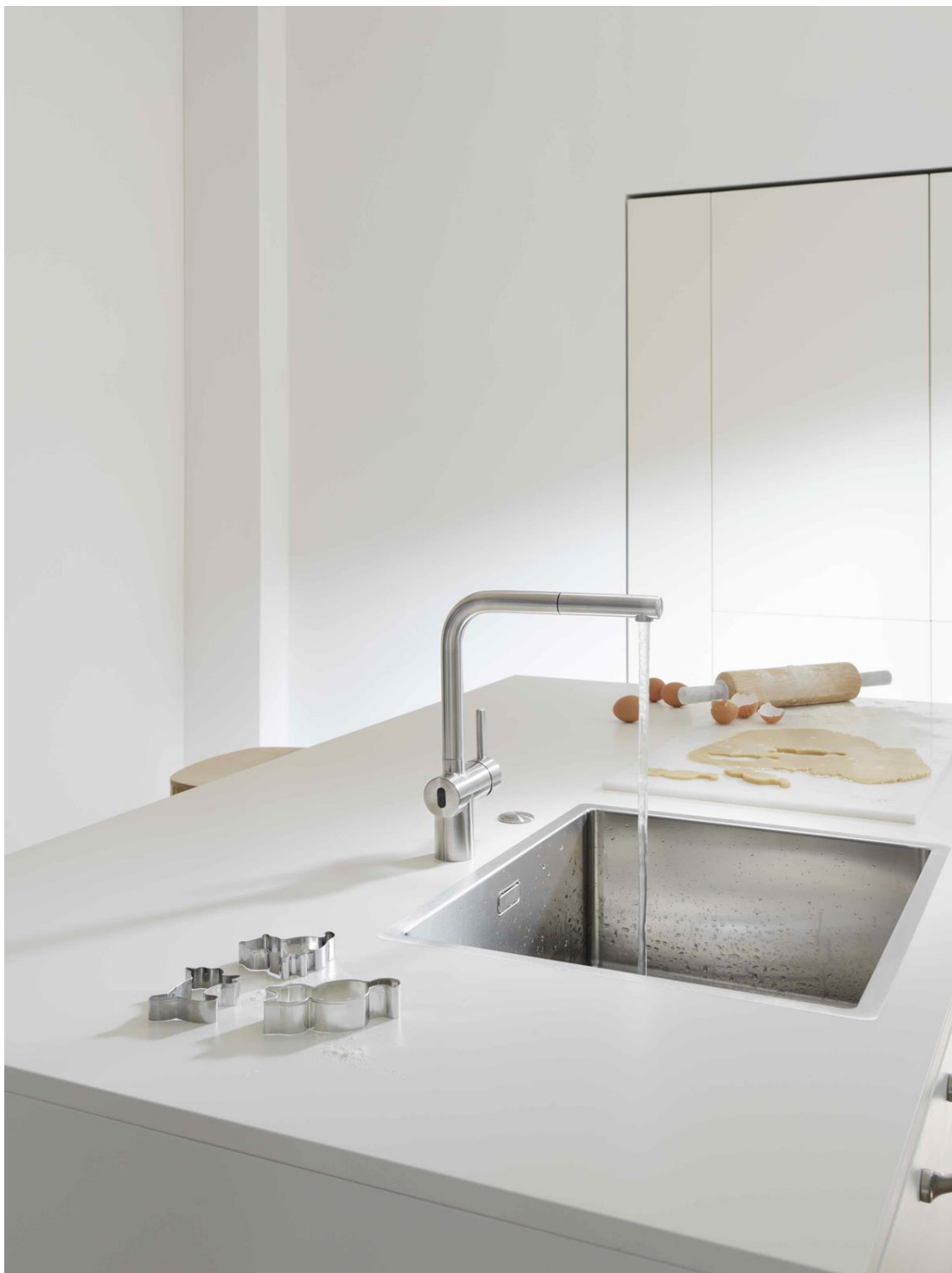
Mitigeur Atlas Neo Sensor avec bec extractible, inox. Prix : 1 013,52 € TVAC.