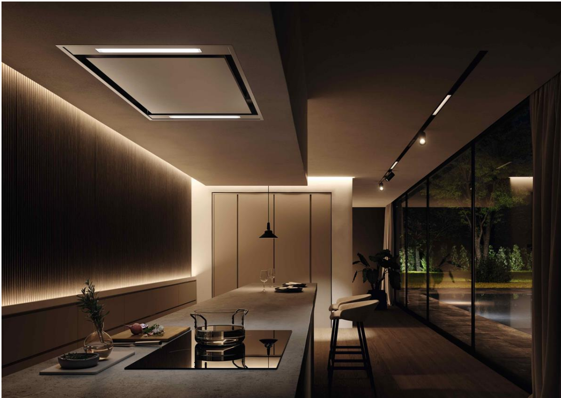
Hotte AQ-sense, lisse/innox. Prix : 2 104,86 € TVAC.