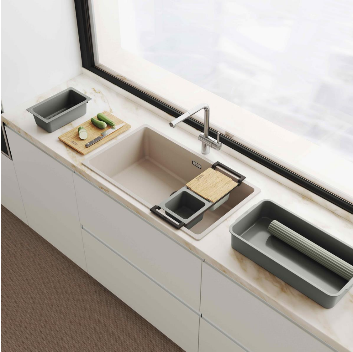
Évier Maris Fraganite, beige. Prix : 821,59 € TVAC.