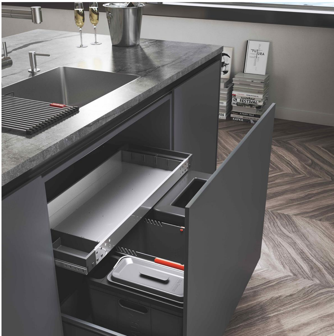
Bac de tri 250, 3 compartiments. Prix : 419,37 € TVAC.