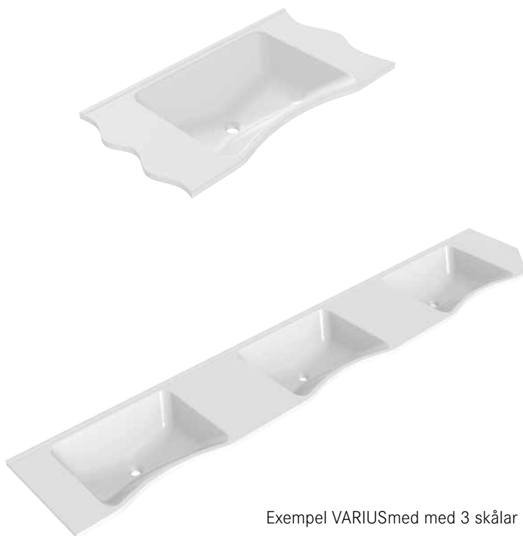
Exempel VARIUSmed med 3 skålar

Detaljerade specifikationer såsom typ av installation och skål-avstånd etc. ges beroende på beställningen i form av produktionsdatablad (begär av Franke).