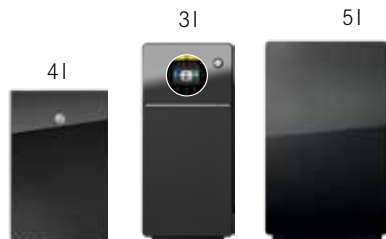
Des unités de refroidissement en option, dimensionnées selon vos besoins : 4l KE200, le nouveau 3l SU03 avec option, système de paiement intégré, 5l SU05