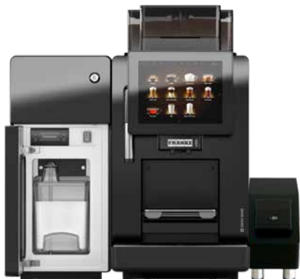
A300* avec unité de refroidissement SU03 et appareil auxiliaire de décompte