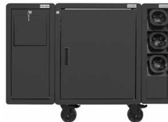
Stockage des gobelets Poubelle Surface d'appui rabattable