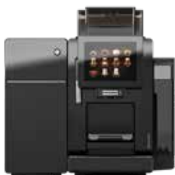
A300* avec réservoir d'eau et unité de refroidissement SU03