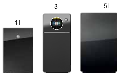
Optionale Kühleinheiten, die auf Ihre Bedürfnisse zugeschnitten sind: 4l KE200, die neue 3l SU03 mit optionalem, integriertem Zahlungssystem, 5l SU05