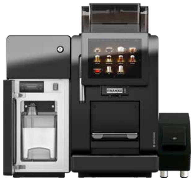
A300* mit Kühleinheit, SU03 und Abrechnungsgesät