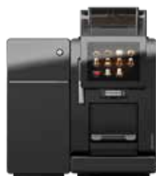
A300* mit Wasseranschluss und Kühleinheit SU03