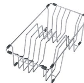
Gocciolatoio per stoviglie

Anche la vaschetta forata, come il tagliere, può essere spostata nel lavello, facilitando così il lavaggio e lo spostamento di pietanze e utensili da cucina.