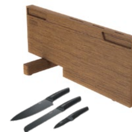
3 coltelli e un blocco portacoltelli

Fanno parte degli accessori due taglieri ideati su misura, in legno e plastica, su cui è possibile preparare perfettamente gli ingredienti.