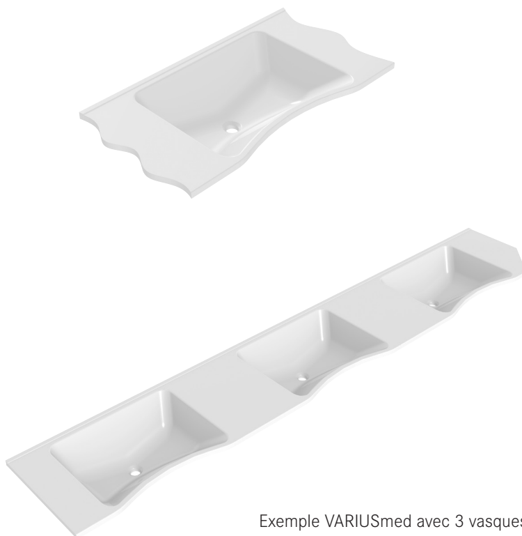
Exemple VARIUSmed avec 3 vasques