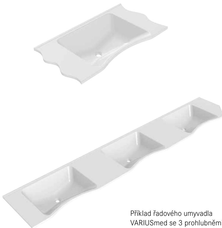
Příklad řadového umyvadla VARIUSmed se 3 prohlubněmi