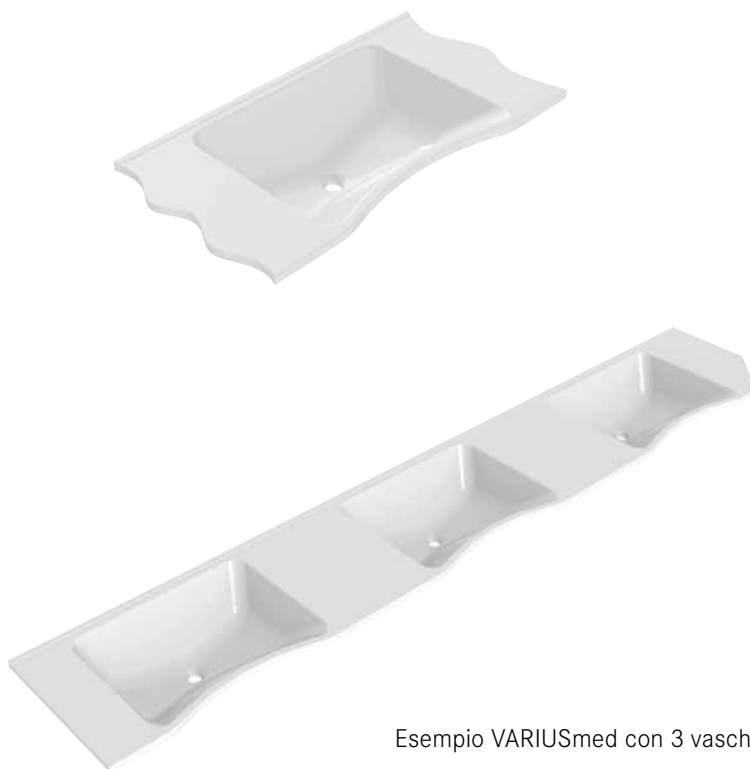
Esempio VARIUSmed con 3 vasche

Specifiche dettagliate e personalizzate, quali la tipologia richiesta o le distanze tra le vasche, sono inserite nella scheda di produzione secondo il singolo progetto (da richiedere a Franke).