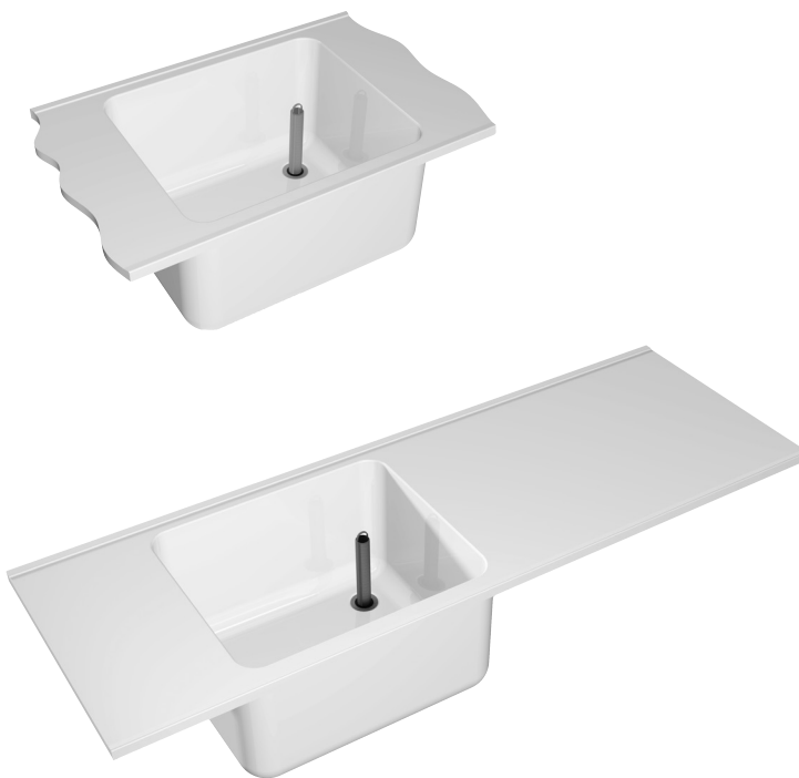
Esempio di lavabo multiuso VARIUSmed con vasca posizionata