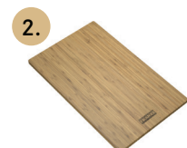
Planche de hachage en bambou

Muni de rails extensibles en acier inoxydable avec des poignées durables pour un ajustement à des cuvettes jusqu'à 21 1/4 po. Comprend de petites pattes reposant sur le rebord de l'évier, afin d'en assurer la stabilité.