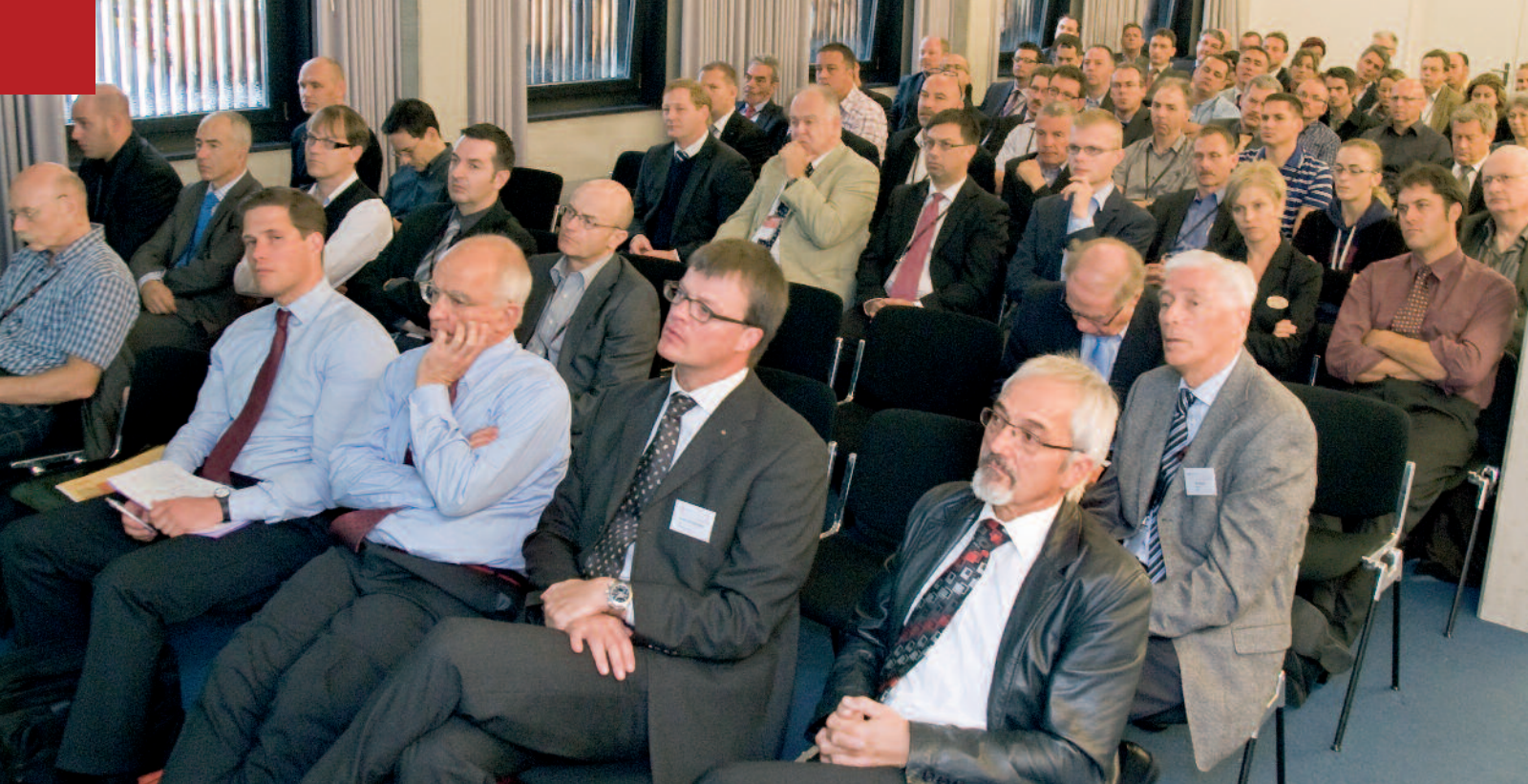
Aufmerksames Auditorium am 5. ZAGG-Symposium zum Thema «Nachhaltigkeit».